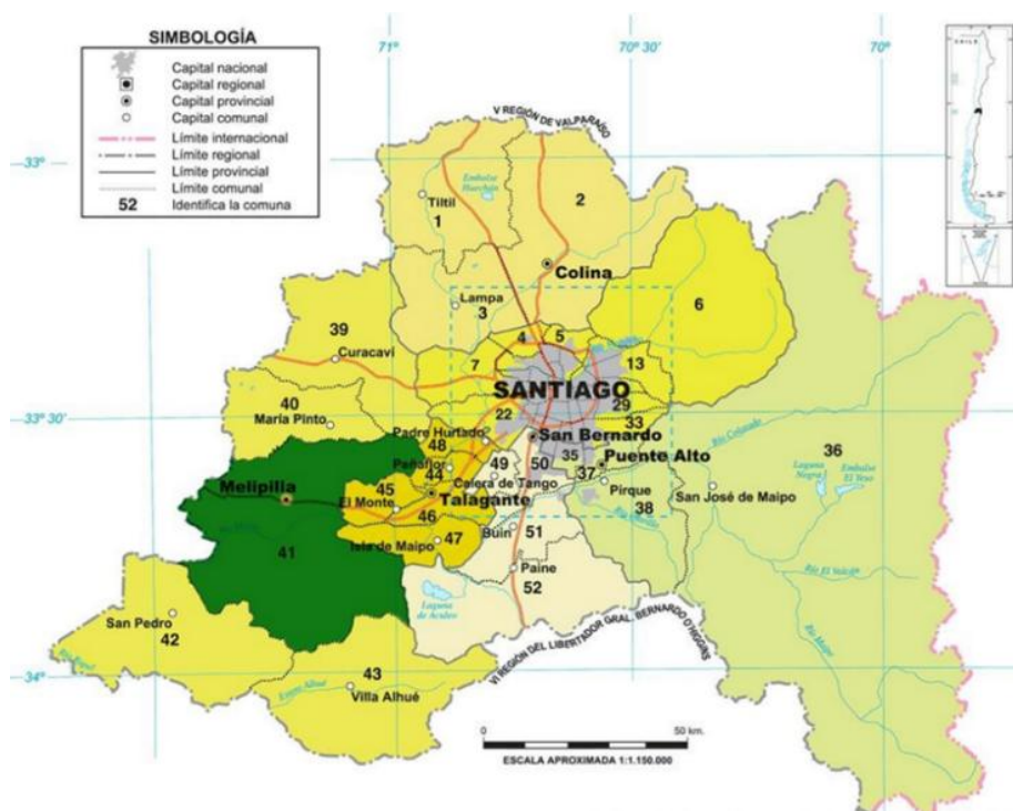
Figura 1: Mapa de localización de la Comuna de Melipilla